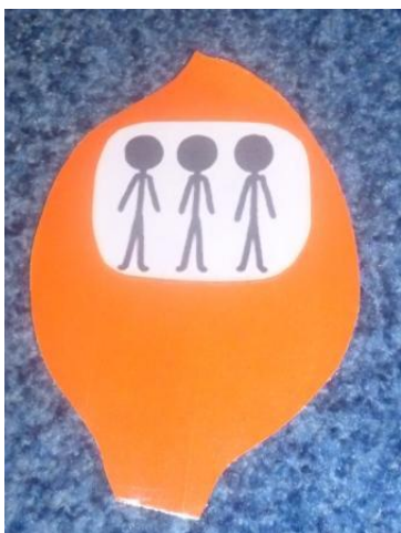
одиначный вид спорта и не оданачный вид спорта